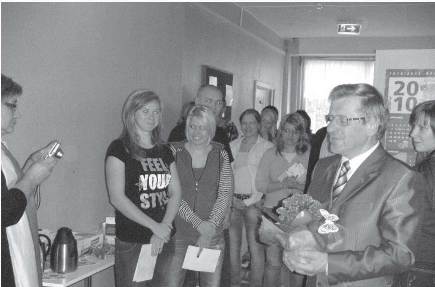
Hetk HMT avamiselt.